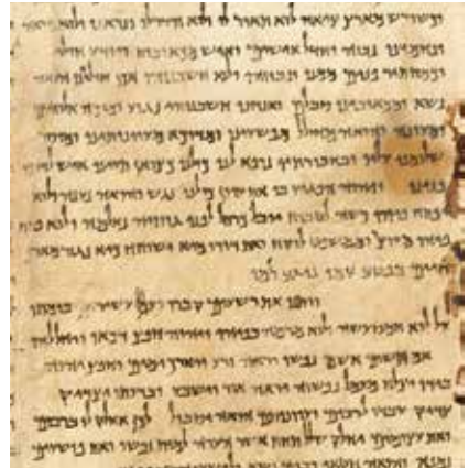
Das vierte Gottesknechtslied in der Großen Jesajarolle von Qumran