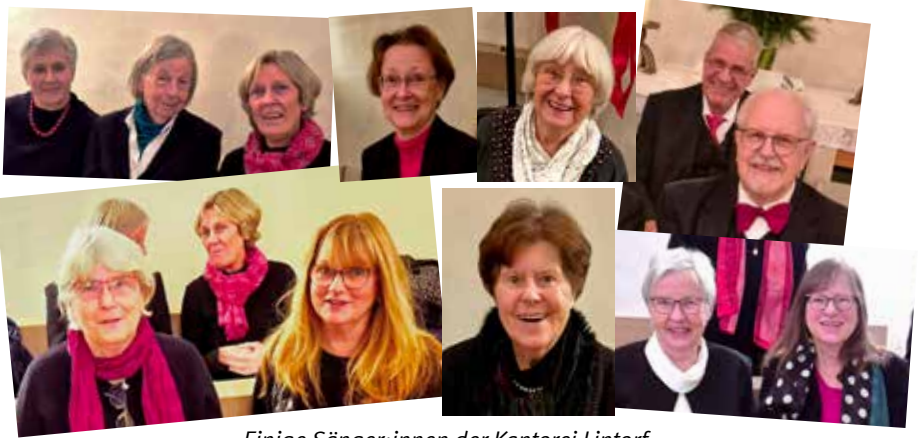
Einige Sänger:innen der Kantorei Lintorf-Angermund beim Adventskonzert 2024

Hier bunt gemischt Bilder von Sänger*innen der Kantorei beim Adventskonzert, vom Kinder- und Familienchor in Vorbereitung des Kindermusicals, vom Gospelchor Colours of Singing, dem Kammerchor Dostojno 'jest', und schließlich dem Jubiläumskonzert „25 Jahre Malembe-Chor“.