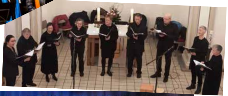
Sänger*innen des Kinder- und Familien- chors am 7.12.2024